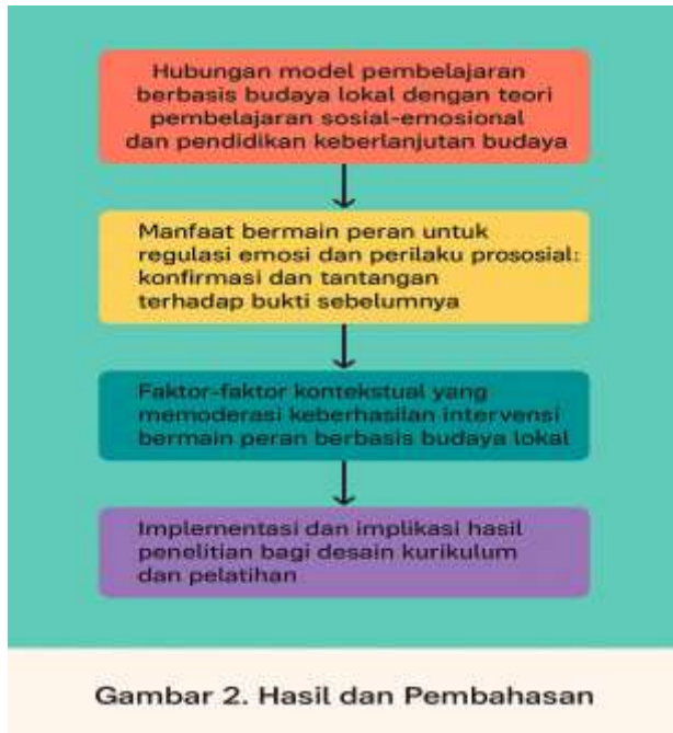
Gambar 2. Hasil dan Pembahasan